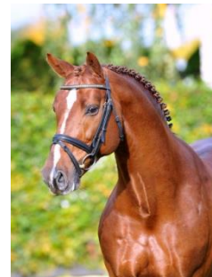
Zinedine , 2004 Guidam - Heartbreaker