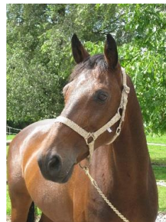
Carrera II , 1996 Carolus I – Lysander